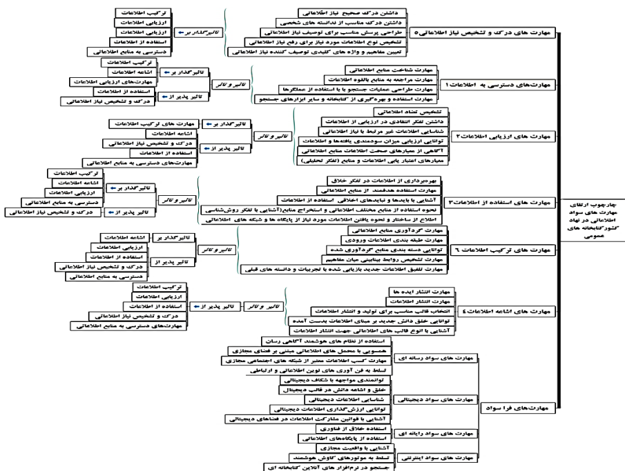
شکل ۲- چارچوب ارتقای مهارت‌های سواد اطلاعاتی برای نهاد کتابخانه‌های عمومی کشور

براساس شکل (۲)، اولویت آموزش هریک از مهارت‌های سواد اطلاعاتی در جهت ارتقای این مهارت‌ها، به این ترتیب است: مهارت‌های دسترسی به اطلاعات، مهارت‌های ارزیابی اطلاعات، مهارت‌های استفاده از اطلاعات، مهارت‌های اشاعه اطلاعات، مهارت‌های درک و تشخیص نیاز اطلاعاتی و مهارت‌های ترکیب اطلاعات.