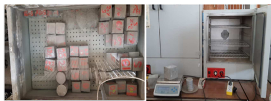
شکل ۴- آزمایش جذب آب نمونه‌ها

به همین ترتیب جهت بررسی دوام ملات، آزمایش جذب آب نمونه‌ها با جایگزینی پوزولان طبیعی مورد بررسی قرار گرفته است. برای آزمایش جذب آب، ملات نمونه‌های مکعبی ۱۰۰×۱۰۰×۱۰۰ میلی‌متر حاوی صفر، ۶، ۱۳ و ۲۰ درصد پوزولان طبیعی جایگزین سیمان شده و بعد از ۱۴ روز عمل‌آوری، برای ۲۴ ساعت در آن در دمای ۱۰۰ درجه سانتیگراد خشک و وزن آن گرفته شد، سپس در آب غرق شده و پس از آن توسط یک ماله، آب سطحی آن خشک و وزن آن دوباره گرفته شده است. این آزمایش برای نمونه‌ها در روزهای ۱۴، ۲۱، ۲۸، ۳۵، ۴۲، ۴۹ و ۵۶ طبق استاندارد ملی ایران شماره ۱۵۴۲۷ و آیین‌نامه ASTM C642 به شکل متواتر مطابق شکل ۴ انجام شده است.