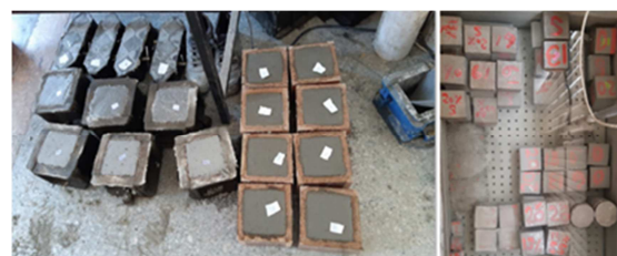
شکل ۱- نحوه ساخت و نگهداری نمونه‌ها

در هر طرح اختلاط، ۹ نمونه مکعب با ابعاد ۱۰۰×۱۰۰×۱۰۰ میلی‌متر برای آزمایش مقاومت فشاری و جذب آب ملات در نظر گرفته شده است. مخلوط آماده شده در قالب‌هایی از قبل آماده و چرب شده با روغن در سه لایه با تراکم ۲۵ ضربه در هر لایه مطابق شکل ۱ ریخته می‌شوند. بعد از قالب‌گیری، نمونه‌ها به مدت ۲۴ ساعت در هوای مرطوب تا ۶۵ درصد و دمای ۲۱ درجه سانتیگراد در شرایط آزمایشگاهی نگهداری و سپس باز شدند. سپس نمونه‌ها در دمای فوق در حوضچه‌های آب به مدت ۲۸ و ۵۶ روز تا زمان آزمایش جهت عمل‌آوری نگهداری شدند.