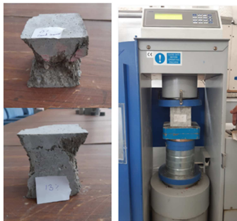
شکل ۳- مقاومت آزمایش فشاری نمونه‌ها

آزمایش مقاومت فشاری نمونه‌های طرح اختلاط‌های حاوی ۶، ۱۳ و ۲۰ درصد پوزولان طبیعی جایگزین شده با سیمان و ماسه معمولی رد شده از الک شماره ۱۰ با حداکثر اندازه ۲ میلی‌متر انجام شده است. نتایج مقاومت فشاری ۲۸ و ۵۶ روزه طبق جدول ۸ نشان می‌دهد که ۶ و ۱۳ درصد جایگزینی پوزولان به ترتیب باعث افزایش ۹/۴۱، ۳۴ و ۹/۱۲، ۱۱/۵ درصد مقاومت فشاری نسبت به نمونه مرجع شده است. به همین ترتیب