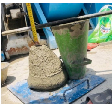
شکل ۲- آزمایش اسلامپ

به سیمان در روانی و کارایی ملات مهم است و باید طوری انتخاب گردد تا خواسته‌های مکانیکی و کارایی را همزمان تأمین نماید. آب بیشتر در ملات باعث ایجاد منافذ زیاد در ملات شده و کاهش مقاومت فشاری را در پی دارد. عموماً خواسته‌های کارایی و روانی در ملات‌های بنایی بر خواسته‌های مکانیکی ارجحیت داده می‌شود. تعیین میزان روانی و کارایی ملات با استفاده از آزمایش اسلامپ براساس استاندارد ملی ایران شماره ۳-۳۲۰۳ و آیین‌نامه ASTM C143 طبق شکل ۲ و مقاومت فشاری نمونه‌ها که یکی از مهم‌ترین خواص مکانیکی و مبنای اصلی برای ارزیابی رفتار ملات‌ها شمرده می‌شود، طبق استاندارد ایران ۳-۱۶۰۸ و آیین‌نامه ASTM C109/C39 مشابه شکل ۳ انجام شده است.